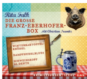
Erhältlich bei buecher.de

// Komisch, bayerisch und erfolgreich: Am kauzigen Franz Eberhofer aus Niederkaltenkirchen kommt im Moment kein Krimifan vorbei. Der gute Kommissar kommt jedem Verbrecher auf die Spur und hat mit seiner charmanten Brummigkeit die Herzen tausender Fans erobert – und auch unseres. Die ersten drei Bestseller der Krimireihe von Rita Falk, „Winterkartoffelknödel“, „Dampfnudelblues“ und „Schweinskopf al dente“ werden kongenial und facettenreich von Christian Tramitz gelesen. Da haben sich zwei gefunden!