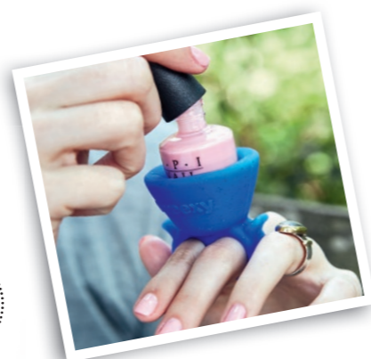
Erhältlich bei amazon.de

// Endlich eine Erfindung, auf die die Welt schon lange gewartet hat! Jetzt hat das Kleckern und Klecksen beim Nagellackieren ein Ende, denn Tweexy ist da! Der kleine Beauty-Helfer sieht aus wie ein überdimensionaler und quietschbunter Kunststoffring und funktioniert ganz einfach: über zwei Finger ziehen, Nagellackfläschchen darin platzieren und mit dem Verschönern der Nägel loslegen. Der Clou kommt zum Schluss, denn ist man mit dem Lackieren fertig, lässt sich Tweexy nach oben abziehen ohne die Nägel zu berühren. Wir sagen, da hat jemand mitgedacht!