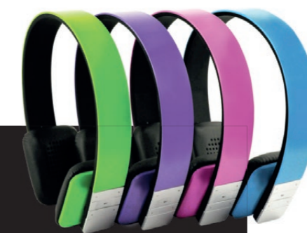
Erhältlich in vier Farben bei shop.schwaiger.de

// Wir möchten nie wieder einen anderen haben, denn er ist der schönste weit und breit! So lässt es sich rundum cool und trendig im Park oder beim Relaxen zuhause aushalten. Der Bügelkopfhörer von Schwaiger eignet sich für alle gängigen Bluetooth-fähigen Geräte und das eingebaute Mikrofon macht ihn sogar zu einem vollwertigen Headset. Das Modell passt sich perfekt jeder Kopfform an und ist dadurch unglaublich bequem. Aber natürlich ist er nicht nur schön, sondern überzeugt auch mit seiner Klangqualität und der hohen Akkulaufzeit.