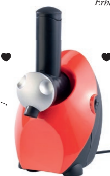
Erhältlich bei amazon.de

// Auch wenn der Sommer vorbei ist: Der Laune am leckeren Eis muss das keinen Abbruch tun! Doch wer nur ein kleines Tiefkühlfach sein Eigen nennt, kann maximal einen Liter Eis aufbewahren – eine Katastrophe, denkt frau an die vielen schönen Sorten. Abhilfe schafft diese kompakte Maschine für Sorbet und Joghurteis. In nur 60 Sekunden bereitet das Raumwunder Speiseeis ohne Zusatz von Zucker oder Süßstoff zu, Beispielrezepte liegen bei. Zur besseren Reinigung ist das Mahlwerk komplett entnehmbar. Da kann der Herbst kommen, denn kulinarisch bleibt es Sommer!